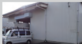
第6倉庫 323 m 2 (97 坪)