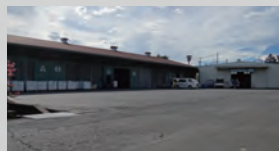
倉庫敷地面積 6,526 m 2 (1,977 坪)