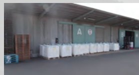
第2倉庫・定温倉庫 1,296 m 2 (392 坪)