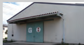
第4倉庫 1,033 m 2 (313 坪)