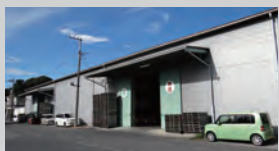
第3倉庫 848 m 2 (256 坪)